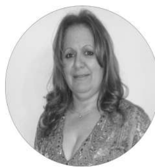
Por: Edluzza Martins